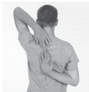
Figure A4-2 Left Shoulder Stretch / Étirement de la coiffe des rotateurs de l'épaule gauche

Note. From Fitnessgram / Activitygram: Test Administration Manual (3rd ed.) (p. 92), by The Cooper Institute, 2005, Windsor, ON: Human Kinetics. Copyright 2005 by The Cooper Institute. / Remarque : Tiré de Fitnessgram/Activitygram: Test Administration Manual (3rd ed.) (p. 92), par The Cooper Institute, 2005, Windsor, Ont. : Human Kinetics. Copyright 2005 The Cooper Institute.