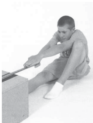
Figure A5-3 The Back Saver Sit and Reach / Exécution de la flexion du tronc vers l'avant

Note. From Fitnessgram / Activitygram: Test Administration Manual (3rd ed.) (p. 92), by The Cooper Institute, 2005, Windsor, ON: Human Kinetics. Copyright 2005 by The Cooper Institute. / Remarque : Tiré de Fitnessgram/Activitygram: Test Administration Manual (3rd ed.) (p. 92), par The Cooper Institute, 2005, Windsor, Ont. : Human Kinetics. Copyright 2005 The Cooper Institute.