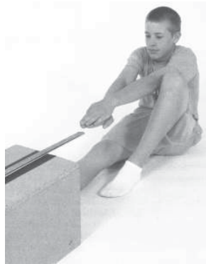
Figure A5-2 Starting Position for the Back-Saver Sit and Reach / Position de départ de la flexion du tronc vers l'avant

g. demander au cadet de répéter les étapes b à f pour l'autre jambe.